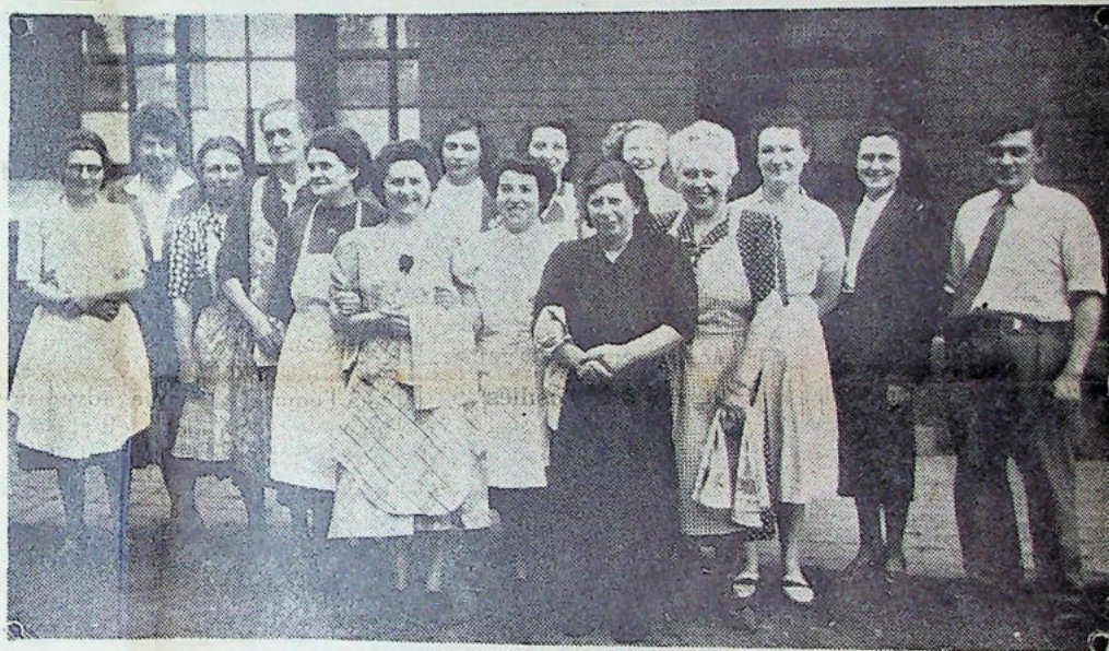
L'organisation de la fête des vieux, nécessita beaucoup de travail et aussi de la part des serveuses, un dévouement auquel nous nous plaignons à rendre hommage. Sur notre cliché : on peut les reconnaître, toutes le sourire aux lèvres peu de temps avant le banquet

DIMANCHE 18 NOVEMBRE - à 20 heures - Salle des Fêtes La Section du TENNIS-CLUB donnera son