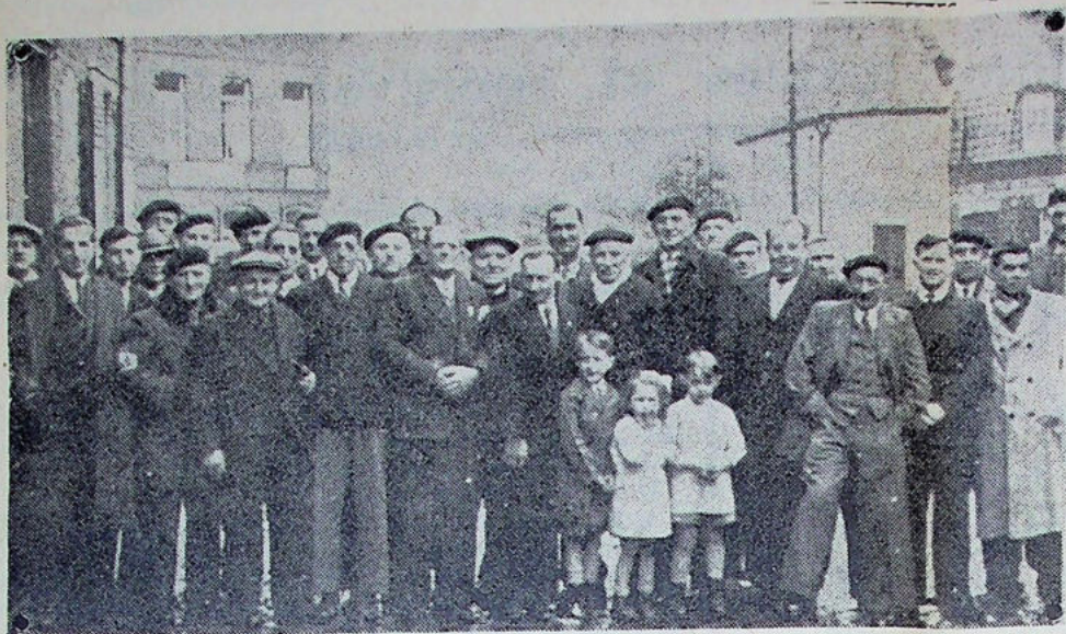
Les « coulonneux » de la « Marque » réunis à Sainghin-en-Mélantois

Le groupement colombophile de la Marque qui groupe les « coulonneux » de Fretin, Sainghin, Ascq et Lesquin s'est réuni, dimanche, au siège de la société de Sainghin, pour se réjouir des beaux résultats obtenus dans la dernière campagne et pour fêter ses lauréats.