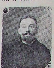
M. Eug. Delval bre, sa présence

Le Cri d'Ascq présente à sa famille, l'expression de ses sincères sentiments de condoléance.