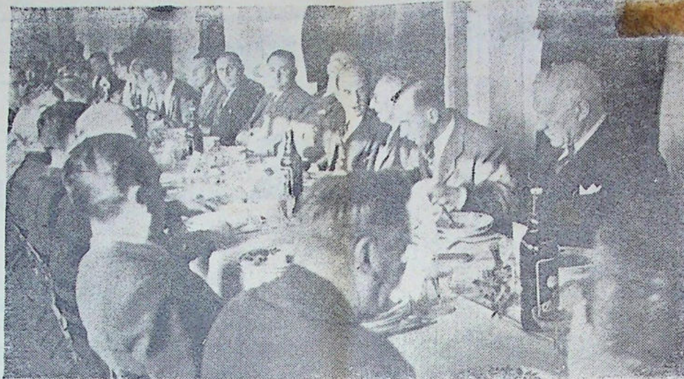
Sur notre cliché quelques-unes des personnalités qui assistaient au banquet de la Philharmonie, lors de la fête de dimanche

Dimanche 7 Décembre eut lieu le Banquet de Ste-Cécile à la Philharmonie.