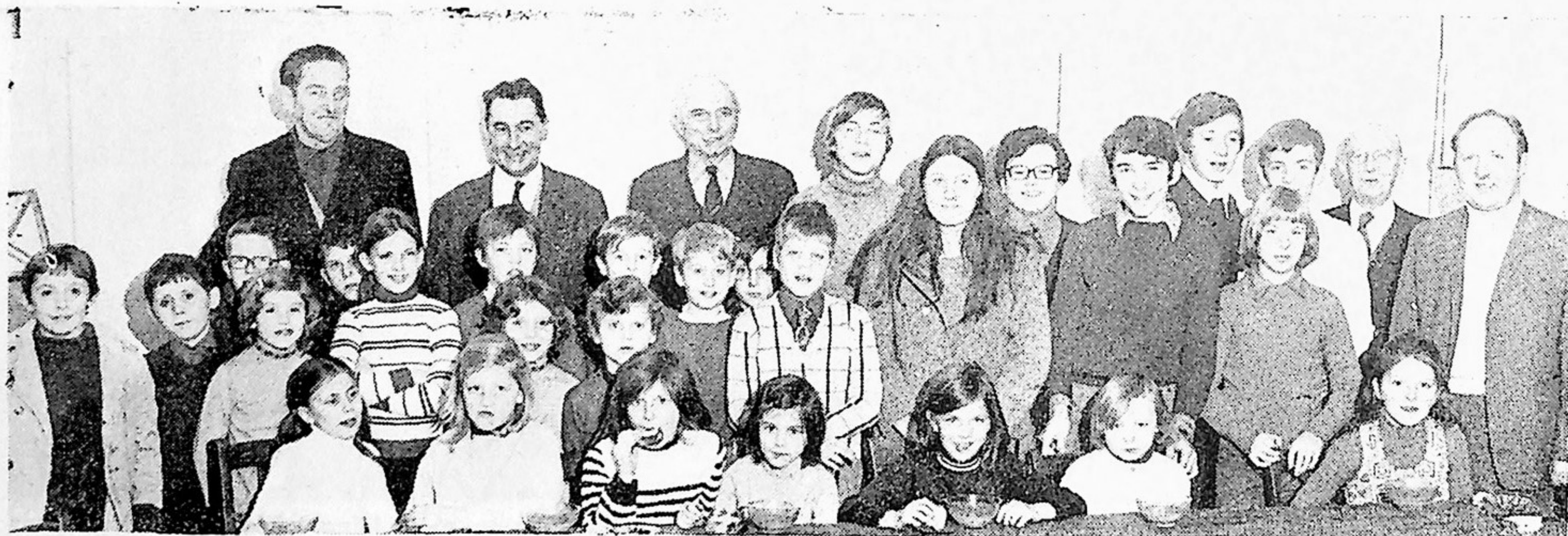
Les enfants entourés de leurs professeurs