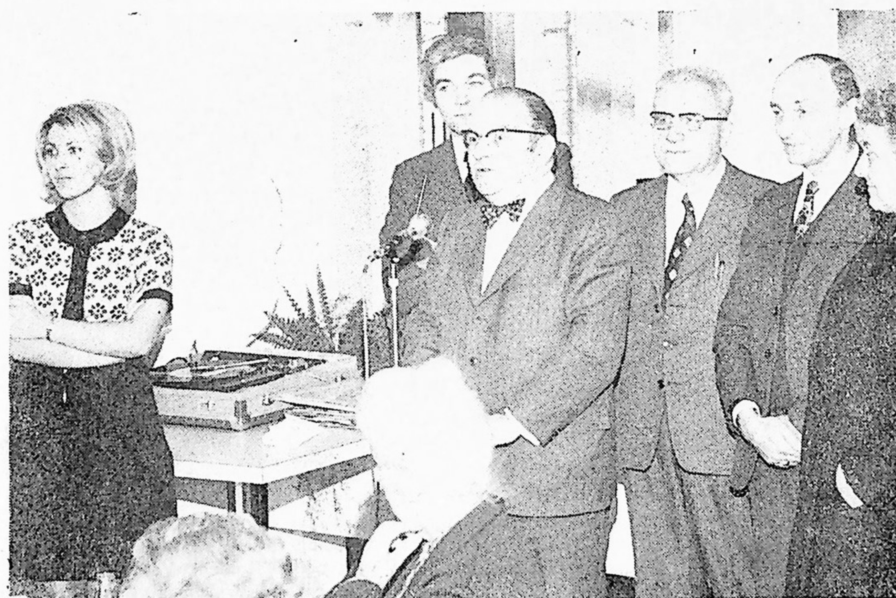
Les administrateurs du B. A. S.