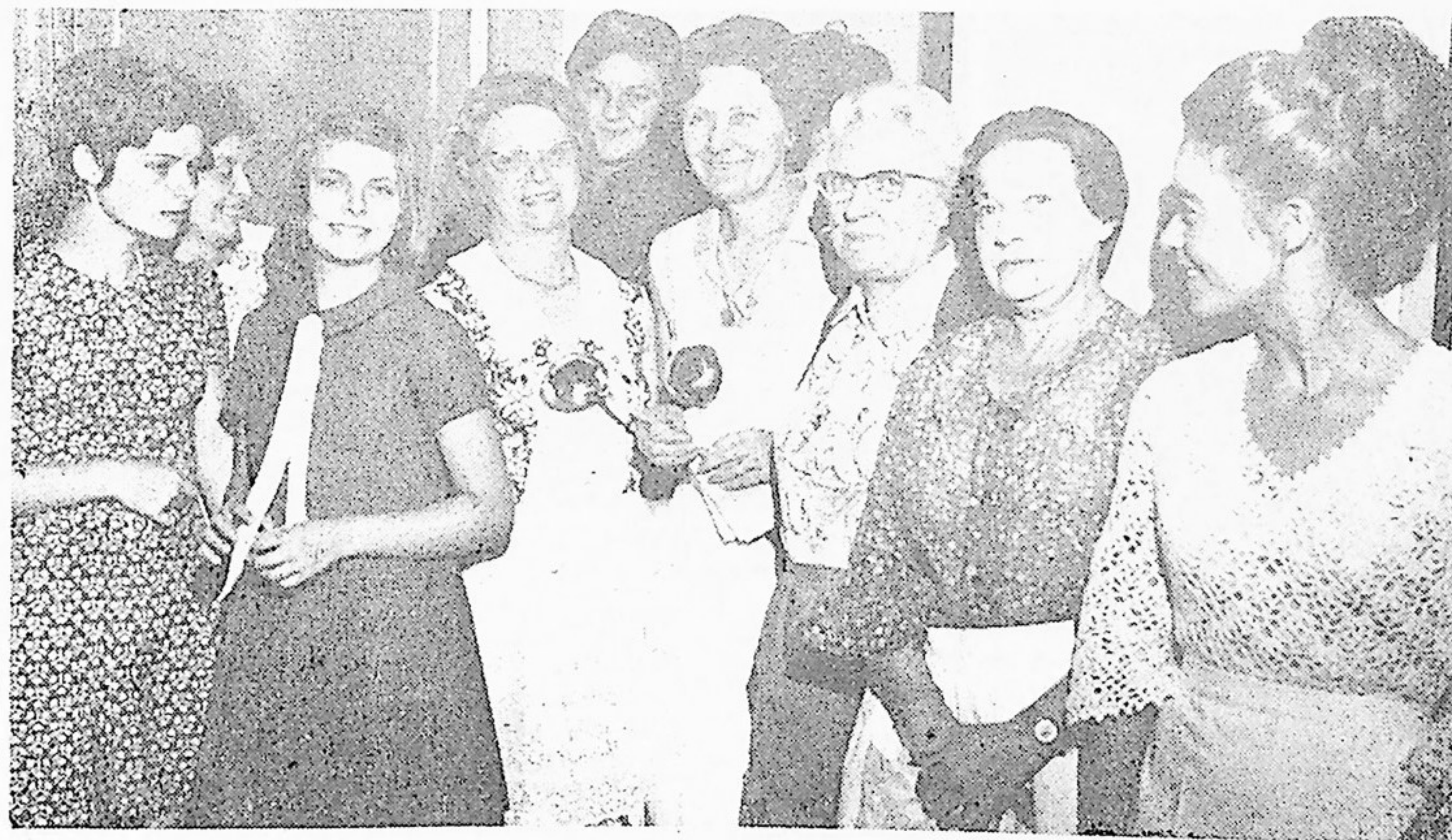
Ces dames bénévoles assurèrent le service aux tables