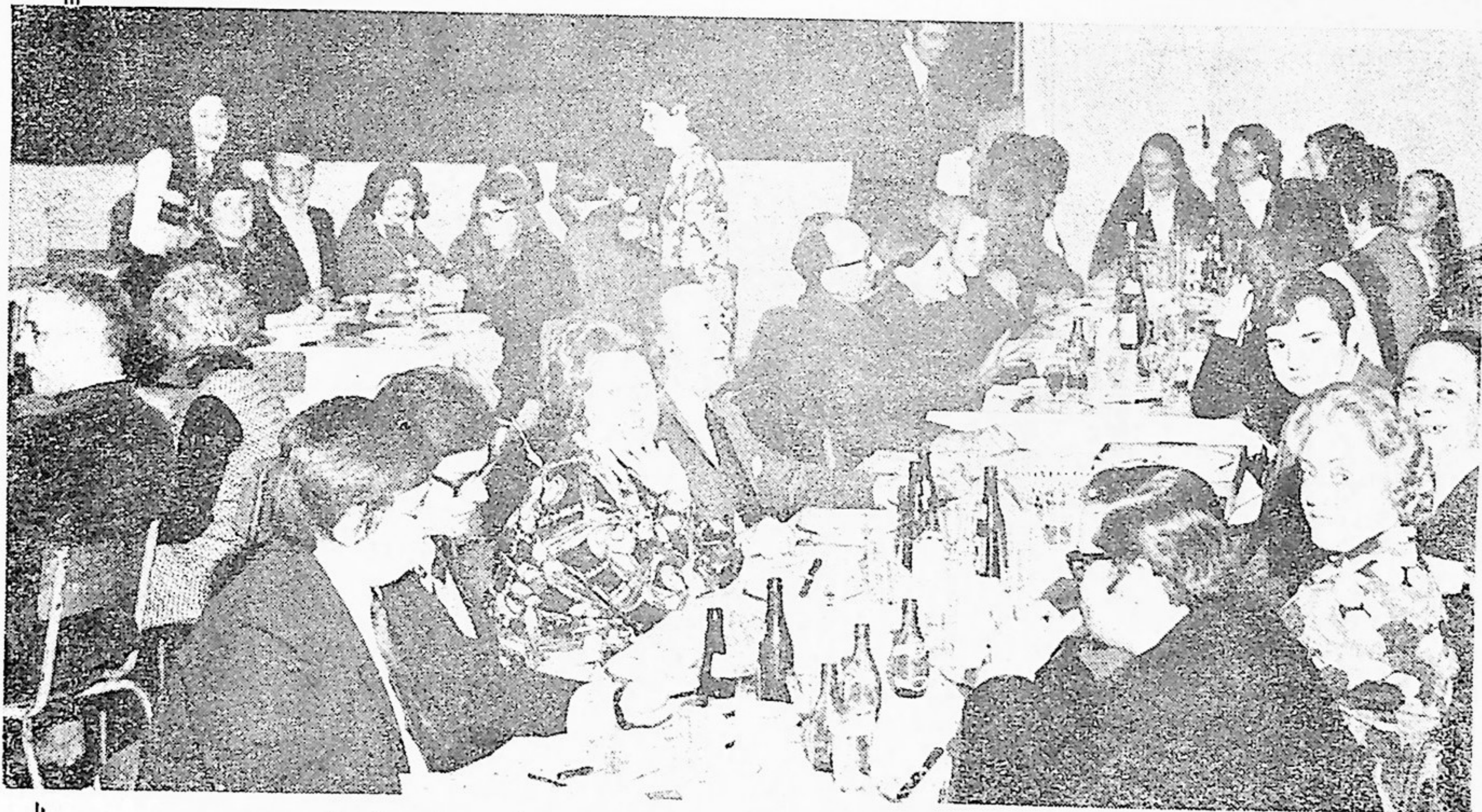
Quelques-uns des convives au début de la soirée.