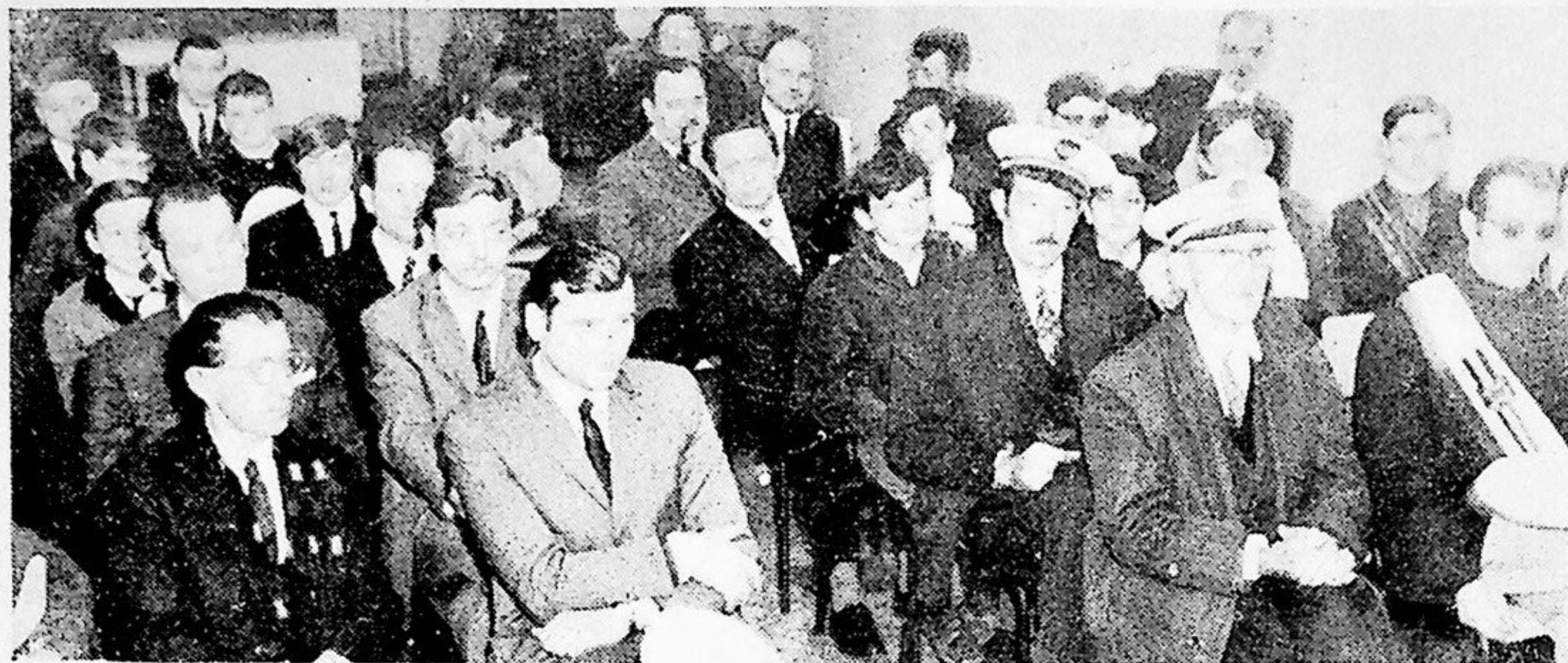
Une vue de l'assistance