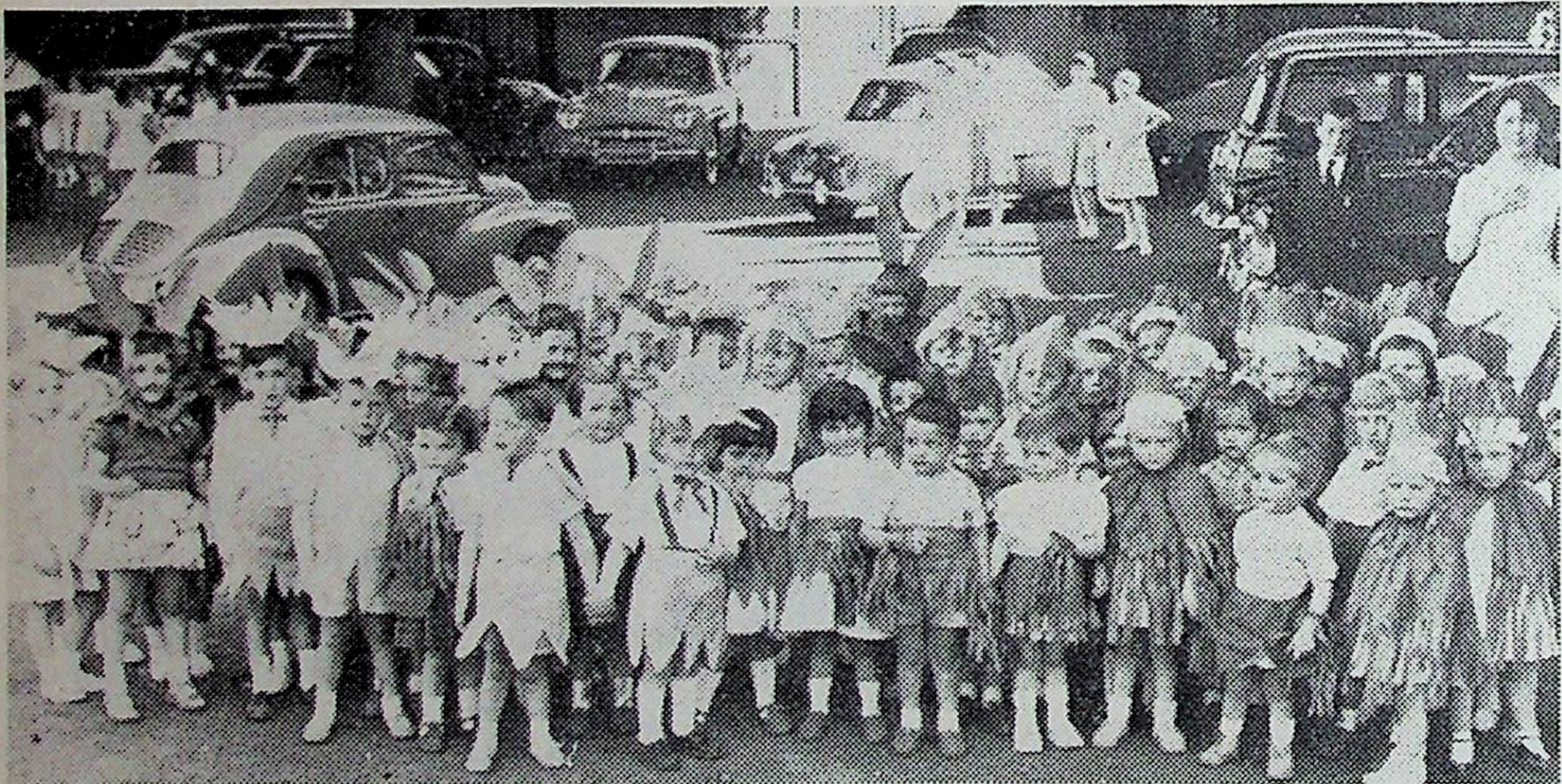
Petits oiseaux et lapins par les classes enfantines ne furent pas les moins applaudis