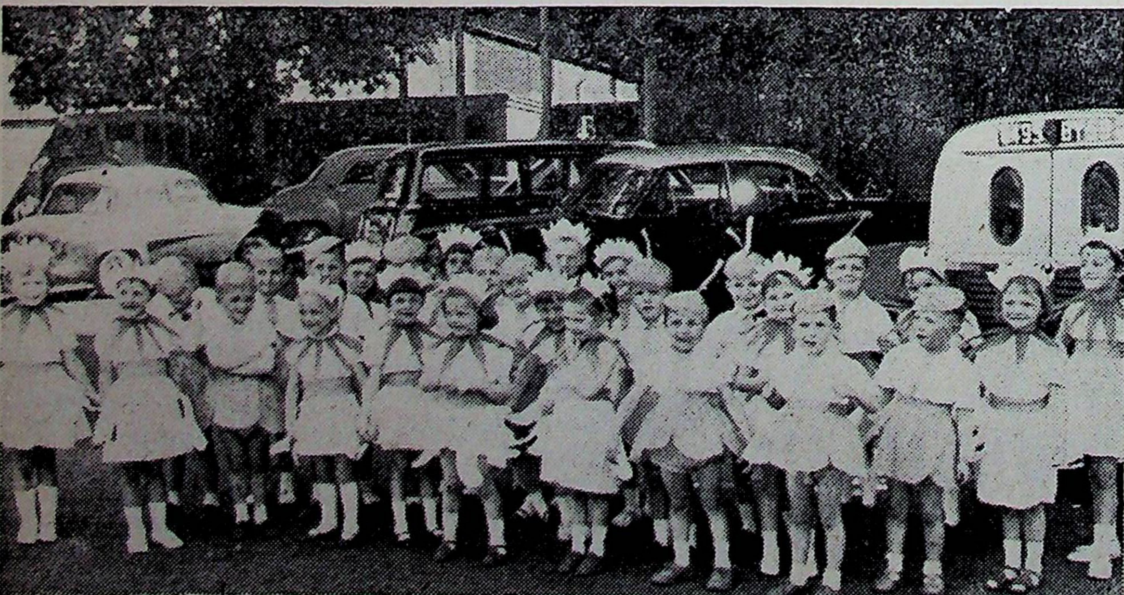
...et d'autres encore, tout aussi joyeux, assurèrent par de ravissantes saynètes, l'enthousiasme de l'assistance