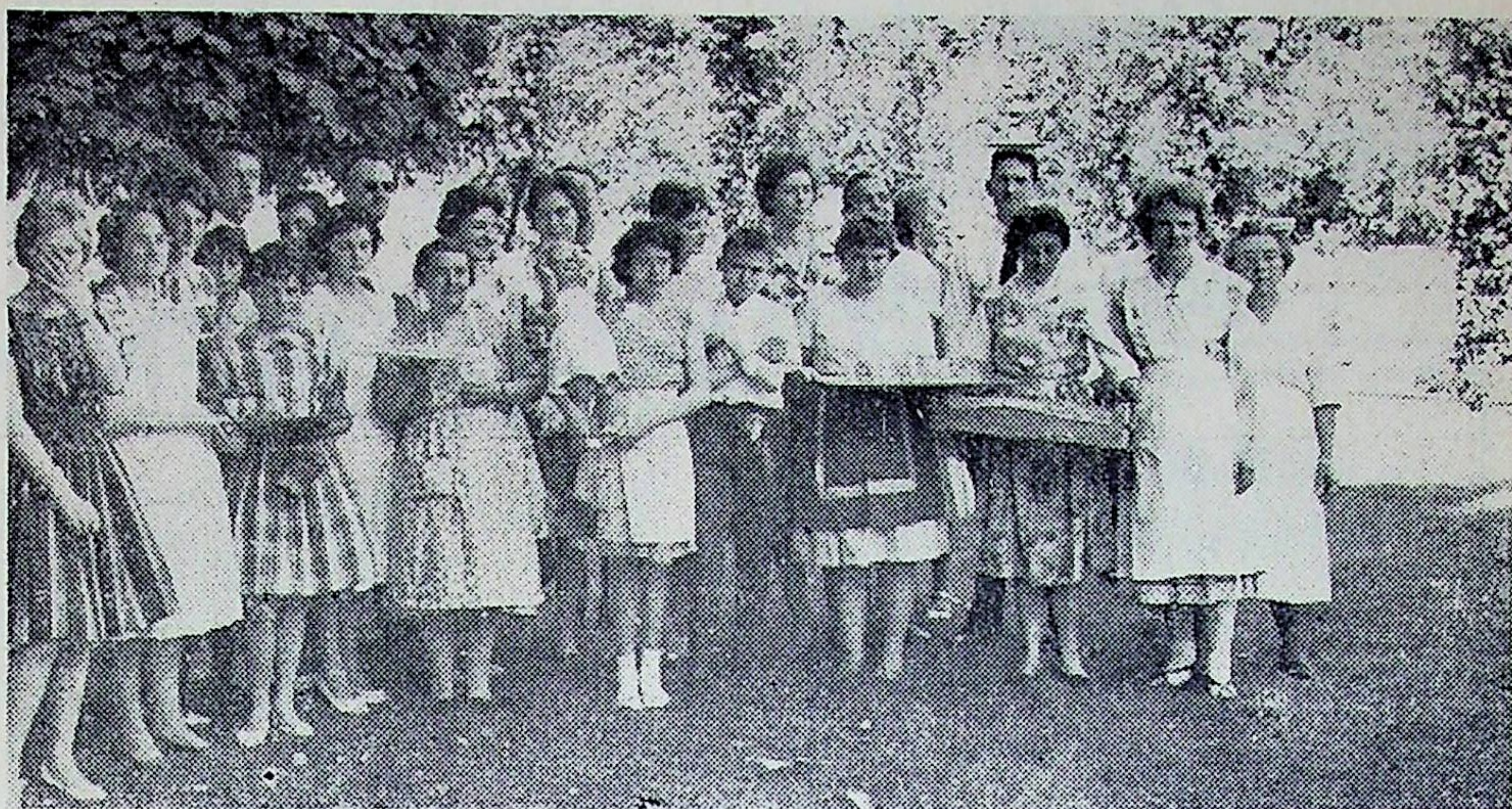
Dans la propriété des "Lauriers" un groupe de dévoués serveurs et serveuses, ont sacrifié leur dimanche pour la Foire aux Plaisirs, au profit d'une bonne œuvre.

Une telle épreuve a trouvé dans l'entourage un large écho de sympathie attristée. Nous présentons aux familles endeuillées par ces coups répétés nos sincères et chrétiennes condoléances.