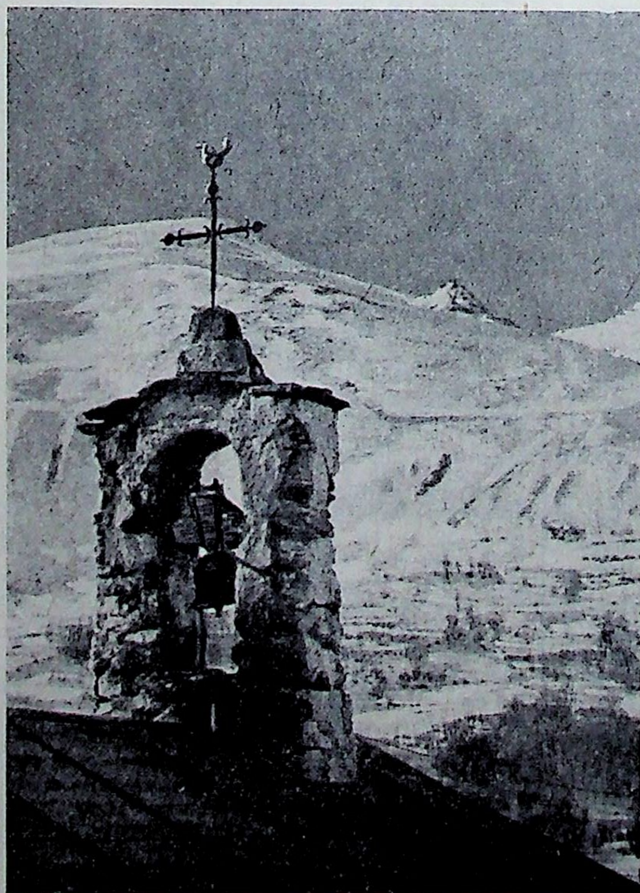
LA HALTE, OU REPREDRE DES FORCES POUR UNE NOUVELLE ÉTAPE.

Que ceci nous invite à réfléchir. Si des parents souhaitent avoir un fils prêtre, qu'ils pensent d'abord à main-