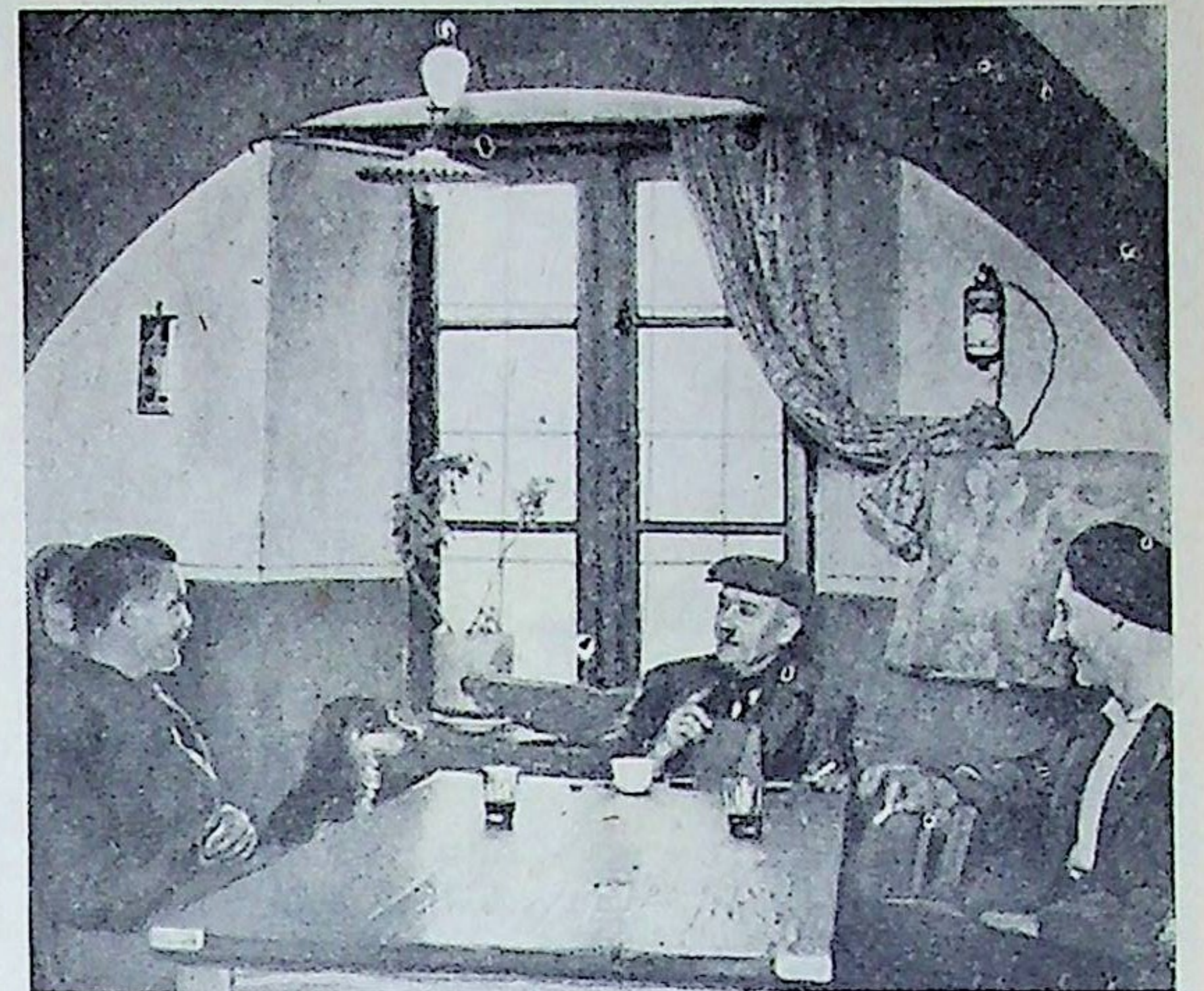
JOIE DE SE TROUVER ENTRE AMIS : QUE DIEU NOUS GARDE TOUT L'AN DANS SON AMITIÉ

tenir dans leur foyer un climat religieux favorable. L'éducation se fera sous le regard de Dieu, dans l'amour du Christ. On habituera l'enfant à l'effort et au sacrifice ; on ne cultivera ni sa vanité, ni ses caprices, ni sa paresse. Une vocation ne pousse pas dans la mollesse et la facilité.