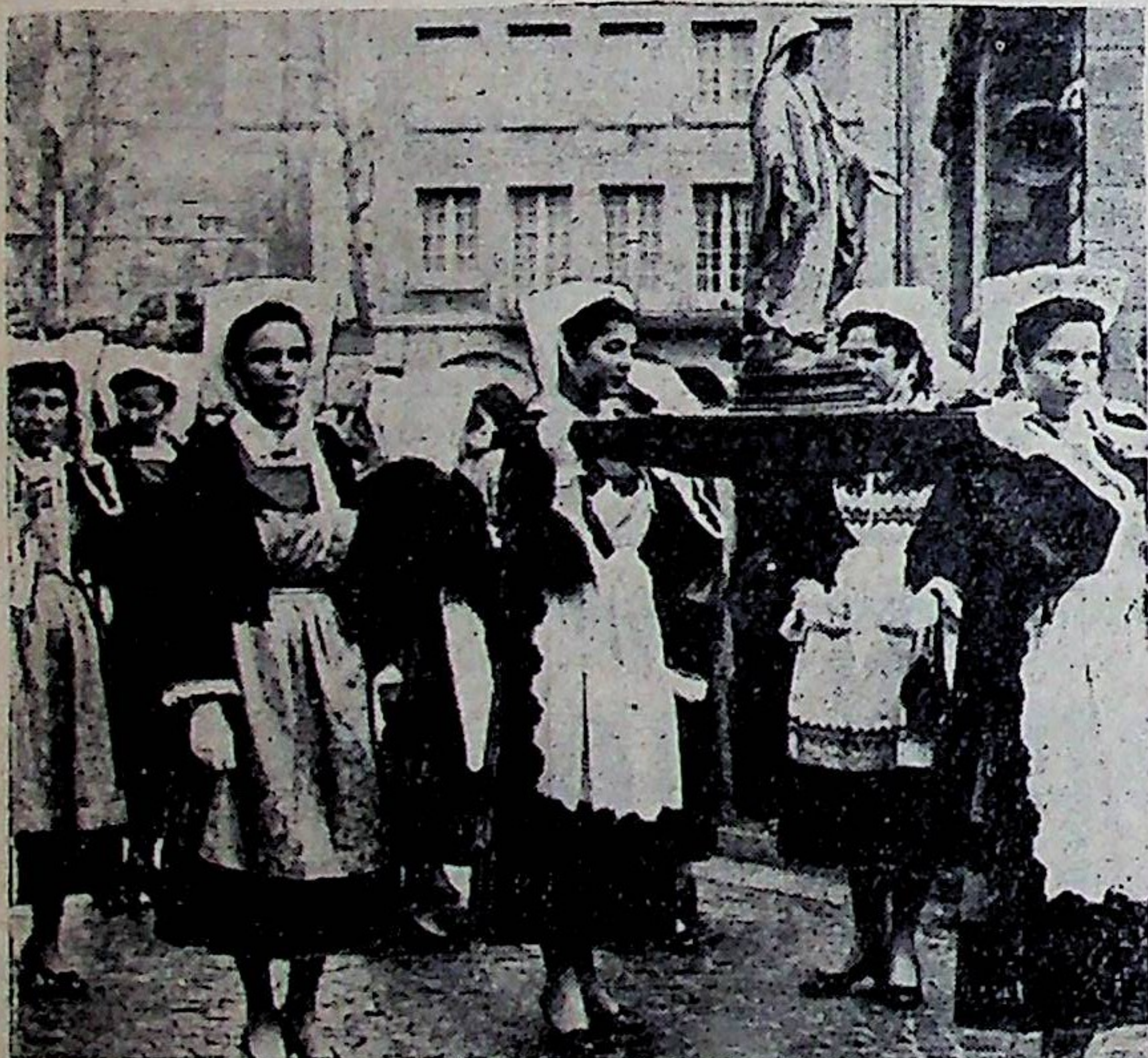
LE PARDON DES TERRE-NEUVAS A SAINT-MALO.

Samedi 5 et dimanche 6 avril : La dernière fois que j'ai vu Paris. — Pour adultes (4 C). Samedi 19 et dimanche 20 avril : Coup dur chez les mous. — Pour adultes (4). Samedi 26 et dimanche 27 avril : Ah ! quelle équipe ! avec Sidney Bechet. — Presque pour tous (3 bis). Les samedis, soirée à 20 heures. Les dimanches, matinée à 17 h., soirée à 20 h.