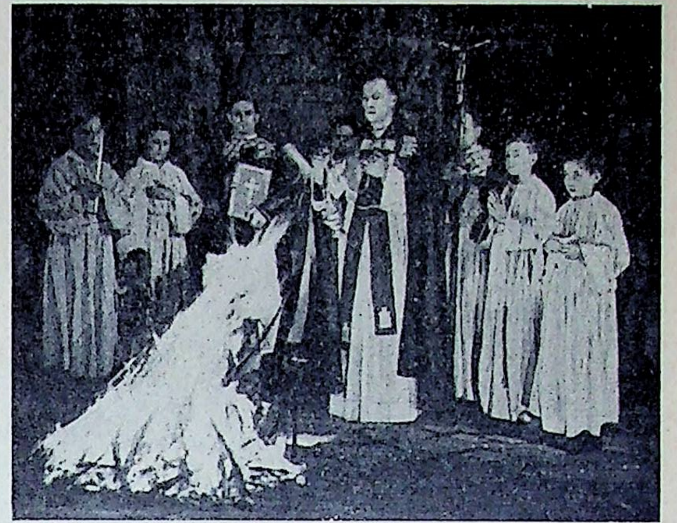
LA BENEDICTION DU FEU NOUVEAU AU DEBUT DE LA VEILLEE PASCALE

D'autre part, si votre enfant bénéficie des Allocations familiales ou d'une organisation équivalente, vous déduirez encore une seconde subvention qui